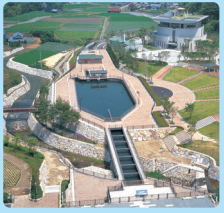
とうざいぶんすいこう、みとよしさいたちょう 東西分水工(三豊市財田町)

こうちけん、さめうら、た、みず 高知県にある早明浦ダムに貯められた水 こうちけん、とくしまけん、なが、よしのがわ、りゅうか は、高知県・徳島県を流れる吉野川を流下 とくしまけん、いけだちてん、あさんさんみやく、ほ し、徳島県池田地点から阿讃山脈に掘ら れたトンネルを通り香川県三豊市にある とうざいぶんすいこう、おく、かがわけん 東西分水工へ送られます。そこから香川県 のほぼ全域に送られる水を香川用水と呼 び、農業用水や生活用水、工業用水にも しよ、かがわけん 使用され、香川県に とってなくてはなら ない水です。